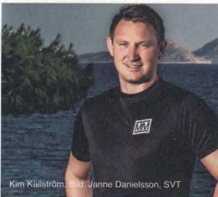
Kim Källström.