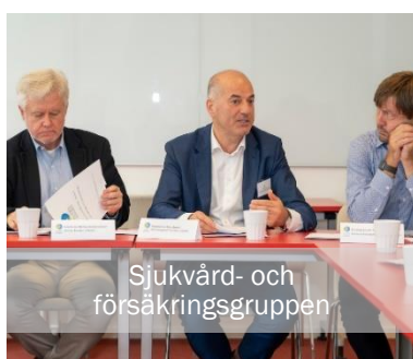
Sjukvård- och försäkringsgruppen