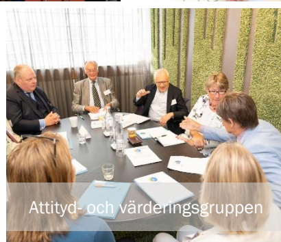
Attityd- och värderingsgruppen