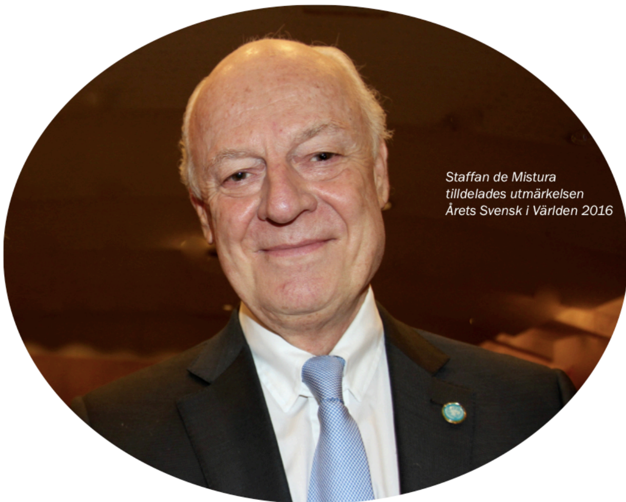
Staffan de Mistura tilldelades utmärkelsen Årets Svensk i Världen 2016