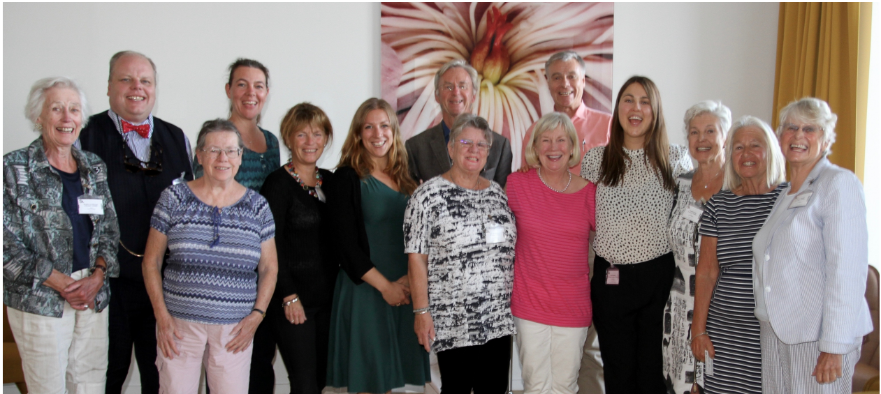
Ombudsträffen i augusti 2016 på Svenska Institutet.

engagera sig som ombud och att vi ska entusiasmera dem att vara aktiva. Vi söker även fler ungdomsombud, för att locka fler yngre medlemmar till organisationen.