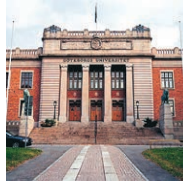
Göteborgs universitet.