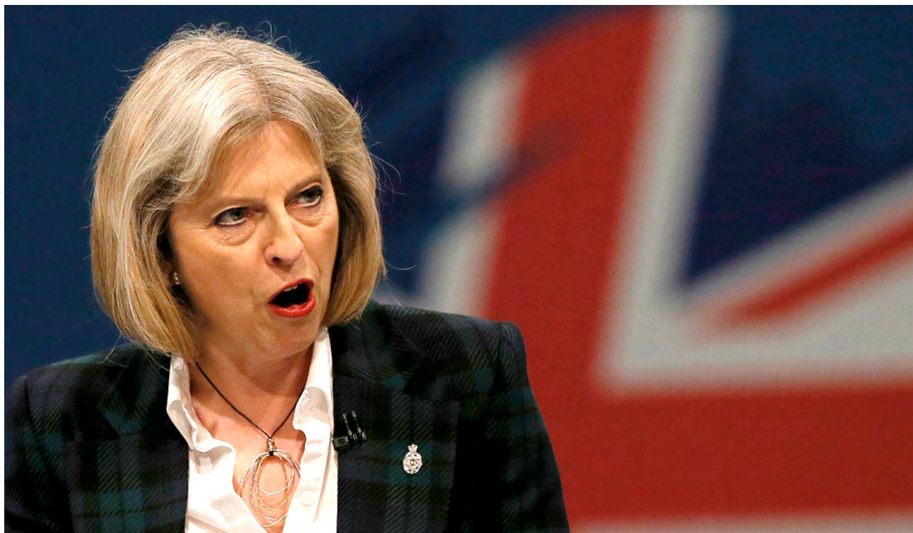
STORBRIANNIEN SKA HA BÄSTA MÖJLIGA HANDELSAVTAL MED EU EFTER UTTRÄDET, HAR THERESA MAY POÄNGTERAT.