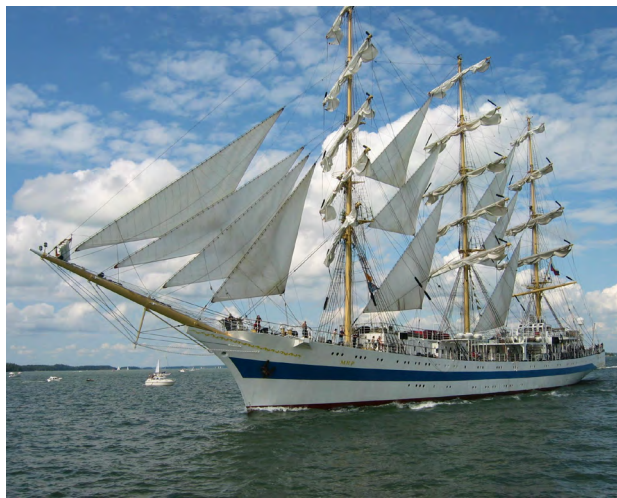
TALL SHIPS RACES GÄSTAR 2017 HALMSTAD I BÖRJAN AV JULI.

Den 26 februari leder komikern Jimmy Kimmel den 89:e Oscarsgalan i USA. Publiksuccén En man som heter Ove är Sveriges Oscarsbidrag i kategorin Bästa icke engelskspråkiga film.