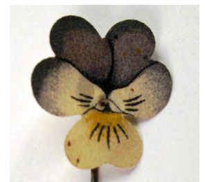
2016 ÅRS BLOMMA MED ANNAN FORM.