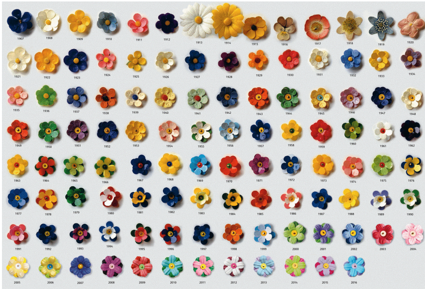
MAJBLOMMAN GENOM TIDERNA