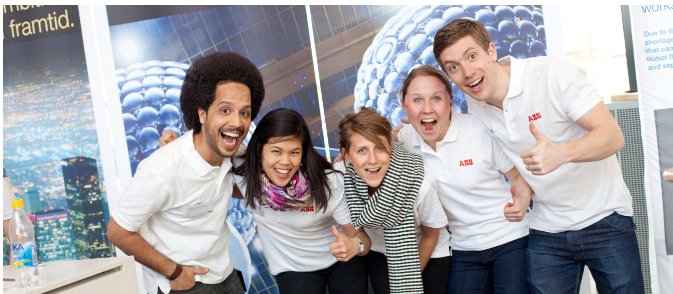
TEXT: ABB FOTO: KIM NORMAN

Oavsett vilken roll du har eller vilket område du arbetar med inom ABB så bidrar du till att skapa en bättre värld. ABB:s världsledande teknik gör världen mer energieffektiv och hållbar.