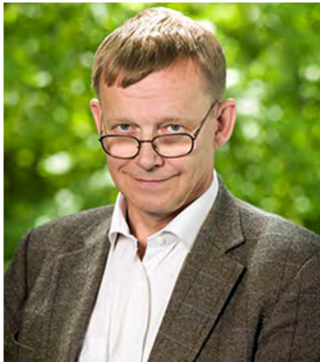
HANS ROSLING VAR ÅRETS SVENSK I VÄRLDEN 2012.