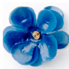
DEN ALLRA FÖRSTA MAJBLOMMAN FRÅN 1907.