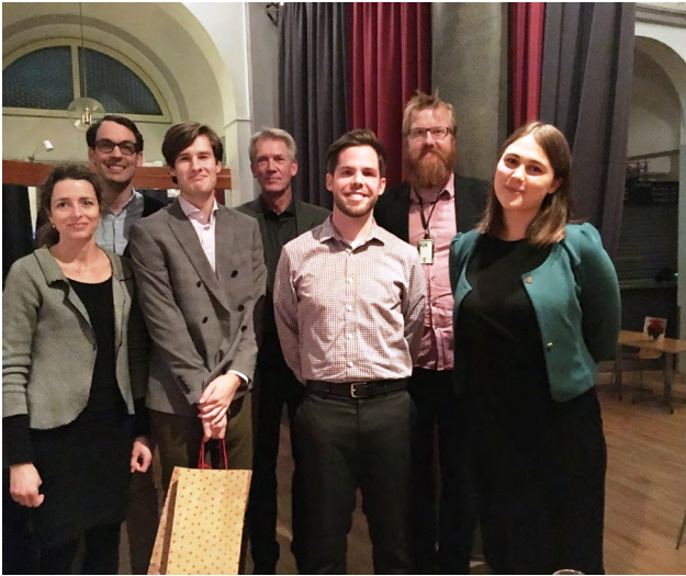
PANELEN PÅ SEMINARIET OM UTLANDSSTUDIER I LUND I NOVEMBER 2016.