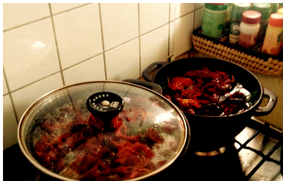
VISST FINNS DET KRÄFTOR OCH DILL ÄVEN I UGANDA. VISSERLIGEN AMERIKANSKA, MEN MYCKET GODA. PRIS: 20 KR/KG.