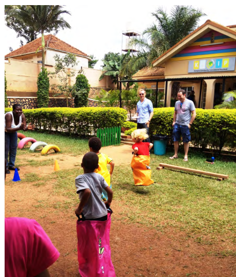
SPORTDAG PÅ FÖRSKOLAN.