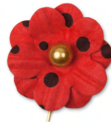
ÅRETS BLOMMA ÄR PRICKIG SOM EN NYCKELPIGA.

Största barnhjälsorganisationen i Sverige För 110 år sedan startade Beda Hallberg Majblomman. Sedan dess har barnhjälsorganisationen utvecklats till Sveriges största. Att köpa majblommor är att hjälpa barn som har det svårt. Glasögon, fritidsaktiviteter och vinterkläder är några exempel på vad pengarna går till.