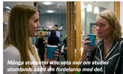
Många studenter ville veta mer om studier utomlands samt om fördelarna med det.

Samtliga paneldeltagare var överens om att när människor flyttar ut ur sin trygghetszon visar man mod och nyfikenhet – det är kvaliteter som är positiva vad man än vill sysselsätta sig med.