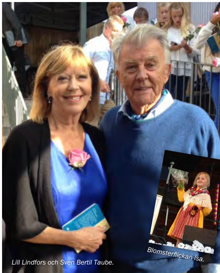
Lill Lindfors och Sven Bertil Taube.