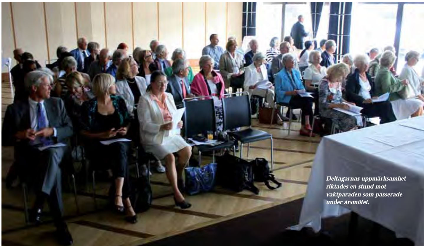
Deltagarnas uppmärksamhet riktades en stund mot vaktparaden som passerade under årsmötet.