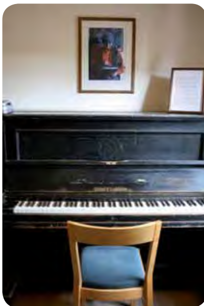
På detta piano spelade Povel Ramel då han var elev i Sigtuna.