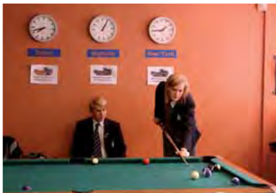
Eleverna kan välja mellan många olika fritidssysselsättningar, bl a biljard.