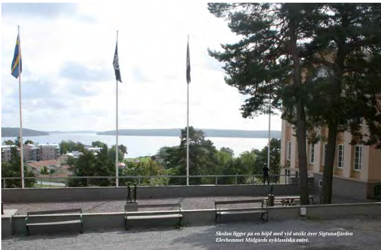
Skolan ligger på en höjd med vid utsikt över Sigtunafjärden Elevhemmet Midgårds nyklassiska entré.

Dummaste frågan i Sigtuna: Vilken är Sveriges bästa internat-skola? Svaret är förstås SSSL, Sigtunaskolan Humanistiska Läroverket. För att citera en av skolans elever: "Much more than just a school." Och det finns förstås en hel drös föredetningar spridda över hela jordklotet som är beredda att instämma.