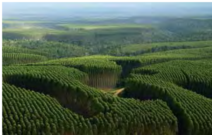
Det är bara sju år mellan bilden till vänster och skogsbilden till höger. Så snabbt växer skogen i Brasilien.