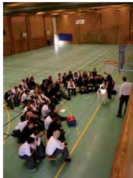
Idrott är viktigt på SSHL.

>> Rom. När jag slutar här kommer jag att ha ett nätverk över hela världen.