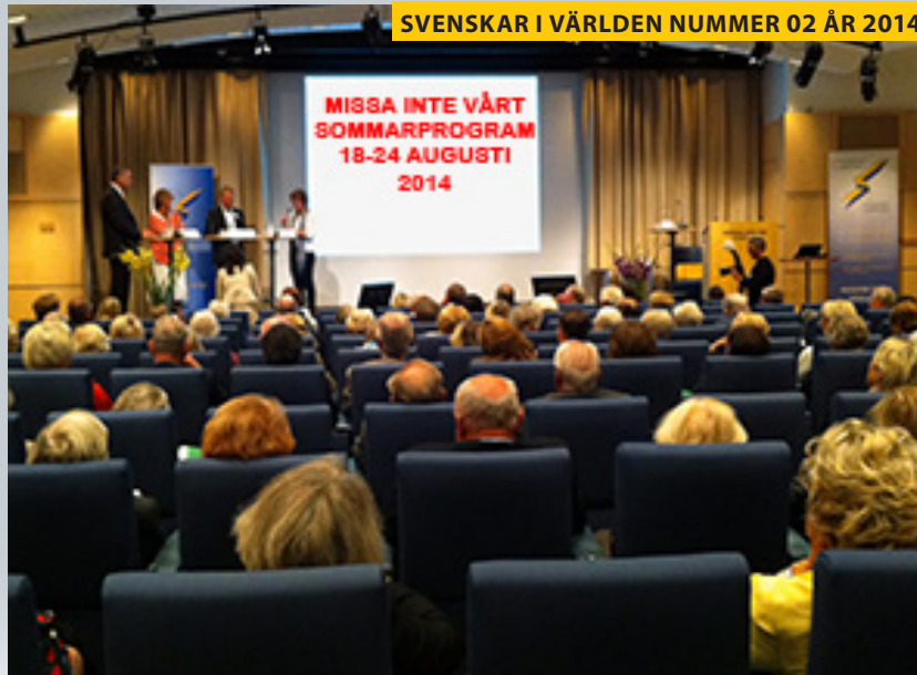
SVENSKAR I VÄRLDEN NUMMER 02 ÅR 2014