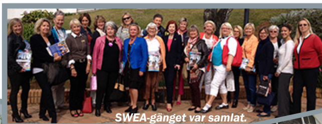
SWEA-gänget var samlat.