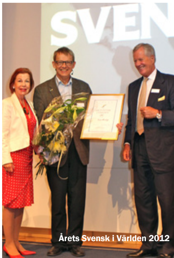
Årets Svensk i Världen 2012