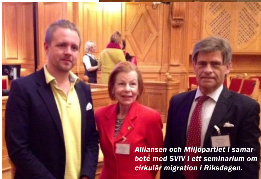
Alliansen och Miljöpartiet i samarbete med SVIV i ett seminarium om cirkulär migration i Riksdagen.