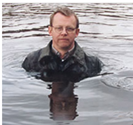
Hans Rosling har sagts vara "humoristisk men dödligt seriös".

Har man sett någon av Roslings faktatäta föreläsningar live någonstans i världen, eller för den delen på Internet, är det enkelt att förstå varför han blivit så populär.