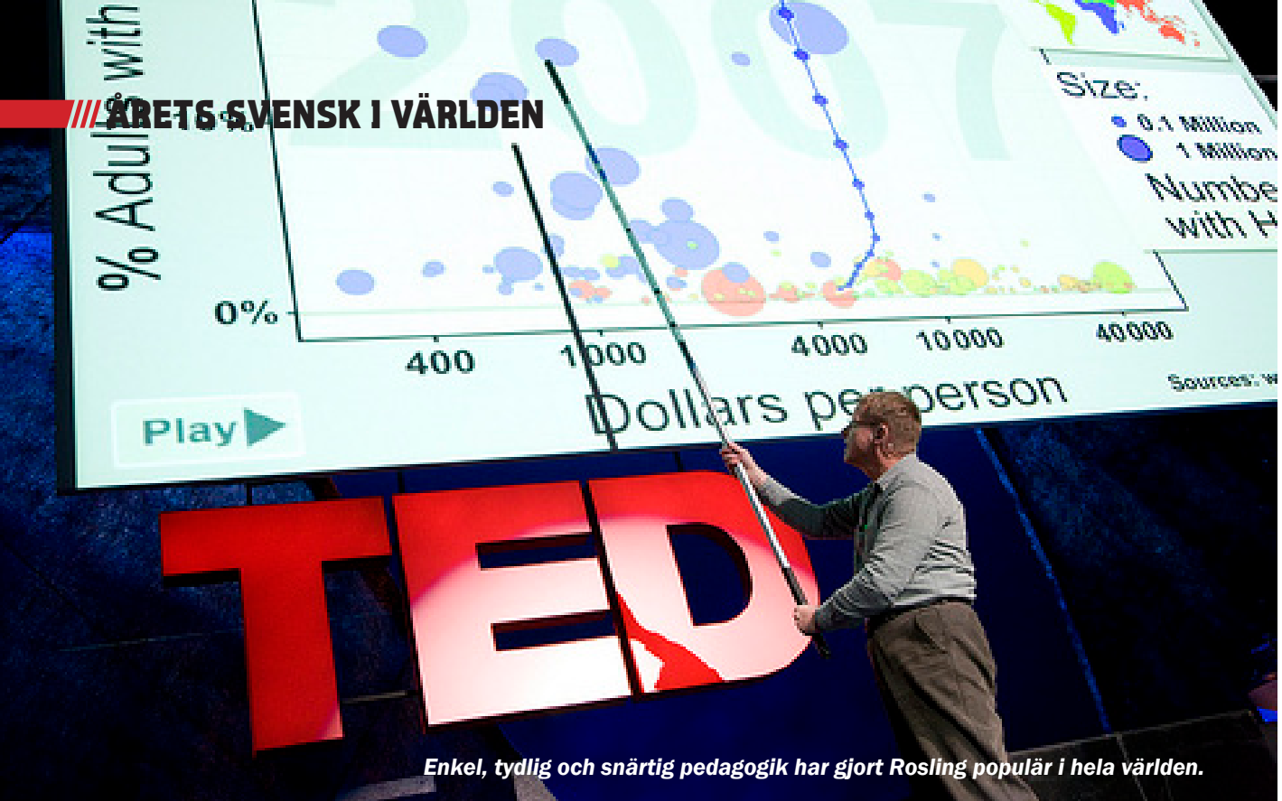
Enkel, tydlig och snärtig pedagogik har gjort Rosling populär i hela världen.

reställa mig att jag en dag skulle vara med på Times lista över de mest inflytelserika personerna eller bli utnämnd till Årets Svensk i Världen. Jag är överraskad att en 63-årig man får så många utmärkelser när det finns så många imponerande unga, kvinnor och invandrare som inte får utmärkelser.