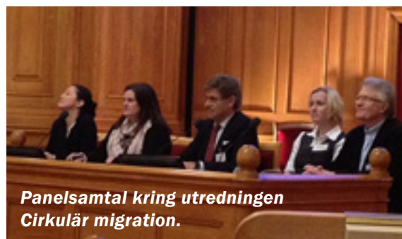
Panelsamtal kring utredningen Cirkulär migration.

– Det var en bra dag, arbetet med den här utredningen är bland det roligaste jag har gjort sedan jag kom in i Riksdagen.