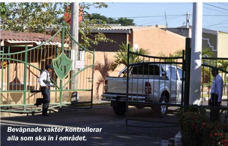
Beväpnade vakter kontrollerar alla som ska in i området.