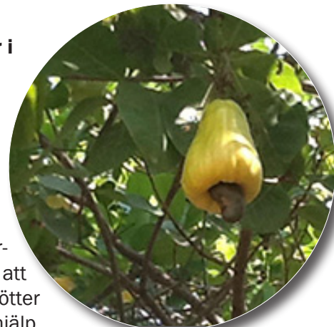
Cashewnötterna växer nedanför frukten. Frukten är gul eller röd, luktar lite illa men är god att frysa och sedan äta eller göra saft på.

– Vi insåg att trots fattigdomen så utvecklas landet och nu etablerar sig amerikanska matkedjor som Subway och Pizza Hut, men här