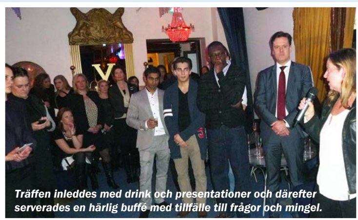
Träffen inleddes med drink och presentationer och därefter serverades en härlig buffé med tillfälle till frågor och mingel.

Är du hemvändare med internationell kompetens kan du ladda upp din CV på MultiMinds hemsida, varefter du sedan kan matchas med rekryterande företag.