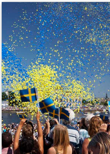
Cermonier i varje kommun.

En ny så kallad portalpara-graf om medborgarskapets betydelse föreslås, vilken ska lyfta fram och stärka medborgarskapets symboliska innebörd. Vidare föreslås att kommunerna ska vara skyldiga att anordna ceremonier för nya svenska medborgare i syfte att högtidlighålla deras nya medborgarskap.